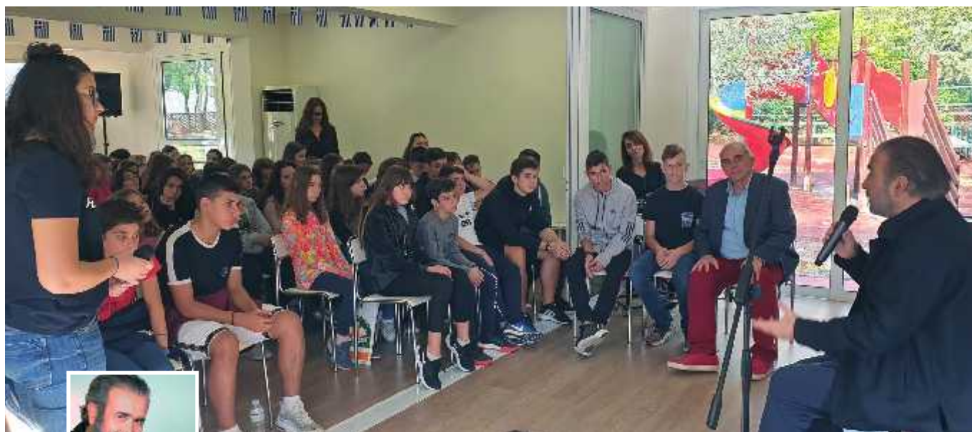
Ο πολυπράγμων Λάκης Λαζόπουλος τιμήθηκε από το σχολείο μας για το "όλο" έργο του και την προσφορά του στην Τέχνη.

Το Γυμνάσιό μας "Παιδαγωγική Πρωτοπορία", που συμπλήρωσε ήδη τα 14 χρόνια λειτουργίας και έχει μπει πλέον στο 15ο, τα Μοντεσσोरιανά Σχολεία και το αδελφό σχολείο Ελληνοαγγλική Αγωγή τιμούν κάθε χρόνο προσωπικότητες ή κοινωνικές ομάδες, που έχουν αφήσει το στίγμα τους στην πνευματική, αθλητική ή πολιτιστική ζωή της πατρίδας μας. Ο πατριώτης Απόστολος Σάντας, ο μουσικοσυνθέτης Μίμης Πλέσσας, ο ολυμπιονίκης Πύρρος Δήμας, ο ηθοποιός Γιώργος Κωνσταντίνου, ο πολυπράγμων Γιάννης Ζουγανέλης, οι εμβληματικοί αρχηγοί της εθνικής ομάδας ποδοσφαίρου Γιώργος Καραγκούνης και ο παλαιότερος Μίμης Δομάζος, η ταλαντούχα Κάρμεν Ρουγγέρι, η συγγραφέας Άλκη Ζέη και η Πρόεδρος των Ελλήνων ολυμπιονικών Σταυρούλα Κοζομπόλη ήταν προσωπικότητες που ήρθαν στο σχολείο μας και τιμήθηκαν για όλα όσα προσέφεραν στην πατρίδα μας, καθώς επίσης και οι οργανώσεις "Χαμόγελο του Παιδιού" και "Γιατροί χωρίς σύνορα".