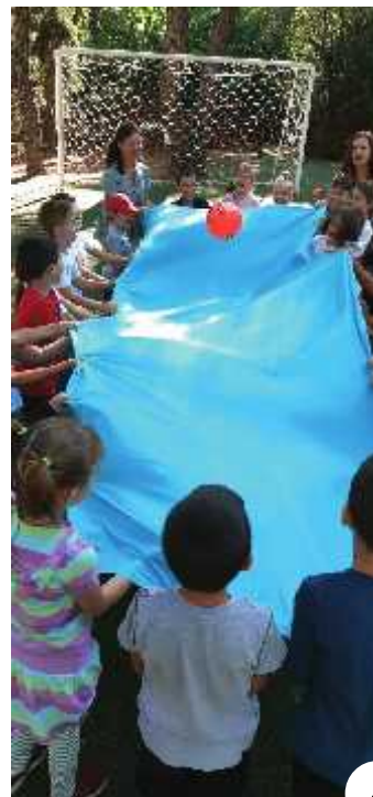
9,10. Στιγμιότυπα από την επίσκεψή μας στο Μουσείο ΟΤΕ.