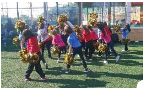
2-5. Στιγμιότυπα από την επίσκεψή μας στο βιωματικό πάρκο "Paradise", όπου τα παιδιά παρακολούθησαν το εκπαιδευτικό πρόγραμμα "Ολυμπισμός και Ολυμπιακά αθλήματα".