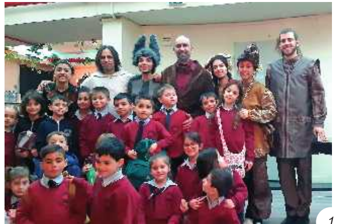
1. Στο θέατρο "Ακάδημος" παρακολουθήσαμε την παράσταση "Ως την Άκρη του Ονείρου".

Ζήσαμε έντονα το πνεύμα των Χριστουγέννων, στολίσαμε την τάξη μας, απολαύσαμε τη χριστουγεννιάτικη παράσταση, που εμείς δραματοποιήσαμε με τίτλο "Τα παιχνίδια ζωντανεύουν", φτιάξαμε κουραμπιέδες και προσφέραμε χειροτεχνίες για το χριστουγεννιάτικο bazaar του σχολείου. Για το αποκριάτικο πάρτι μας ντυθήκαμε μασκαράδες, χορέψαμε και διασκεδάσαμε. Δεν παραλείψαμε βέβαια και φέτος να ασχοληθούμε με διάφορες κατασκευές, όπως μάσκες, ευχετήριες κάρτες, στολίδια από πηλό και πολλά άλλα.